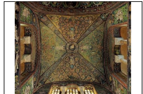
Мал. 7. Базилика Сан-Вітале. Равенна. Італія. XVI ст. [3].

преторії, щоб не осквернитися і їсти Пасху «чистими». Навіть язичник Пілат, який прославився своєю жорстокістю і ненавистю до єврейського народу, намагався виправдати Ісуса: «Ви маєте звичай, щоб я випустив вам одного на Песах. Чи хочете, відпущу вам Царя Юдейського? Та знову вони зняли крик, вимагаючи: Не Його...» (Івана 18: 28, 39-40). Однак намагання залишитися осторонь, здійснивши убивство Сина Божого чужими руками, виглядало як наївна спроба ухилитися від цієї події. Під час виголошення приговору підбурений первосвященниками натовп кричав: «Візьми, візьми і розіпни Його! <...> Кров Його на нас і на дітях наших» (Іоанн 18: 28-38). Ісуса