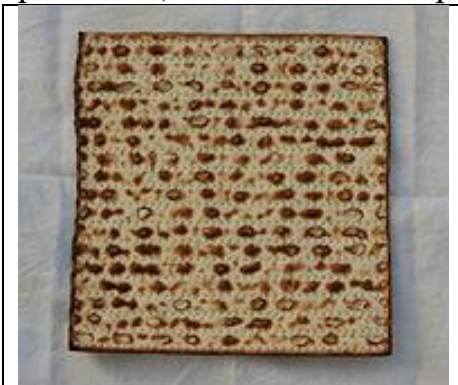
Мал. 2. Маца.

Ламаючи мацу і подаючи її учням, Христос промовив: «Це тіло Моє, що за вас видається; це чиніть на мій спогад» (Луки 22: 19). Маца є сполосованою і проколотою (мал. 2), оскільки символізує «хліб скорботи», а також втілює безгрішне тіло Господа, що пояснює заборону різати хліб. Донедавна в українських селах існувала заборона користувалися гострими предметами для поділу хліба, який зазвичай ламали (пор. з антропоморфізмами: «Хліб усьому голова», «Хліб – батько, вода – мати»). Натомість весільний хліб різали, імітуючи тим самим поділ жертвовної тварини-тотему. Звідси зооморфні назви ритуального хліба – коровай, біл. яловіца або його зменшеної проєкції – рогалик (псл. *koḡva – «корова» < і.-є. *koḡ- «різати»).