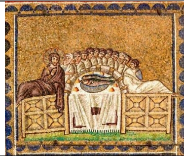
Мал. 4. Тайна вечеря, равенська мозаїка VI ст, базиліка Сант Аполлінаре Нуово [2].