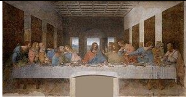
Мал. 3. Фреска «Таємна вечеря», Леонардо да Вінчі, 1495–1497, Санта Марія Делле Граціє, Мілан.

амброзії – небесна їжа, куштування якої дарує безсмертя і вічну молодість. У Євангелії говориться, що: «як із мертвих воскреснуть, то не будуть женитись, ані заміж виходити, але будуть, немов янголи ті на небі <...> Бо Він є Бог не