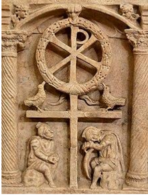
Мал. 8. Воскресіння. Символічне зображення. Кришка саркофагу. Музей Піо-Крістіано, Ватикан.

Історія святкування. На сьогодні дата Великодня обчислюється за місячно-сонячним календарем, що робить його перехідним святом. Натомість єврейський Песах вираховується за місячним календарем. Свято Воскресіння існувало вже при апостолах і спочатку було присвячене спогаду про страту Ісуса Христа, тому на Сході Римської імперії відбувалося 14 нісана, у день приготування євреями пасхального ягня. Великдень став головним святом з початку існування християнської церкви, де Страсна п'ятниця вважалася днем посту і скорботи 4 . Період з п'ятниці до неділі називали «Великоднем хрещеним» (pascha stucificationis), який фактично збігався з єврейським Песахом. Після неї відзначалося власне Воскресіння Христове як «Великдень радості» (pascha resurrectionis). Незабаром стала помітною відмінність