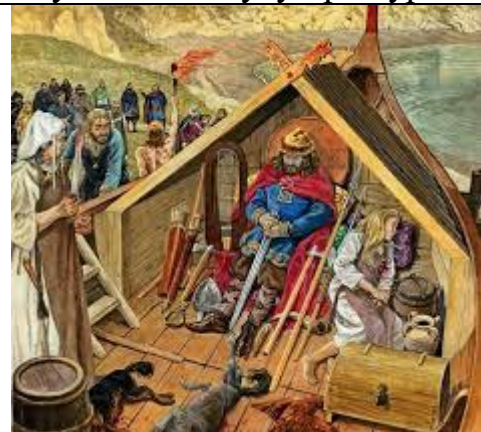
Мал. 68. Реконструкція поховання у будиночку – домовині. Давня Русь. Фото з Інтернету.

З розвитком землеробства набувають поширення інгумаційні поховання. Водночас залишаються архаїчні способи – поховання над землею або на землі, властиві давнім мисливцям і збирачам. Можливо такі поховання практикували взимку під час сильних морозів або за інших обставин, коли не було можливості викопати могилу. Доцільним видається також припущення, що невеличкі хатинки будували для невиліковно хворих, старих і немічних, які ставали «зайвими». Відповідні хатинки властиві фіно-угорським народам, які