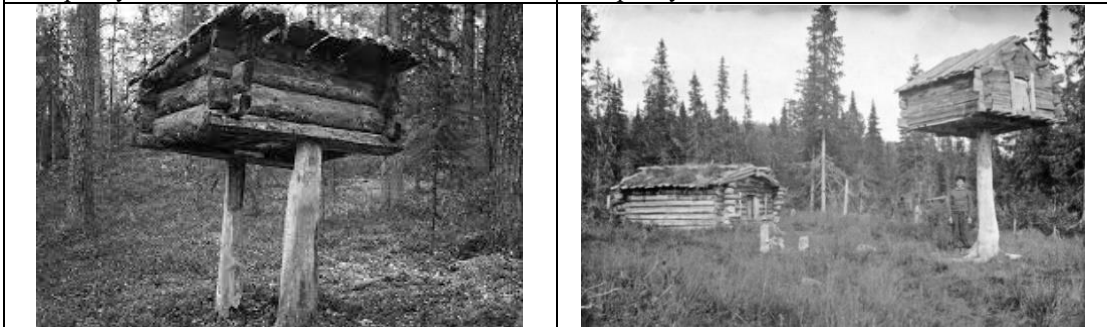
Мал. 73-74. Суцільні стіни «хатинки». Ілюстрація з Інтернету.

Висновки. Традиційне житло має багатовекторну орієнтаційну семантику, яка стосується його цілісної структури і окремих компонентів, які символізують у перспективі простору – міфологічний всесвіт і тіло людини, у перспективі часу – асоціюються з тривалістю життя окремого покоління, що, у свою чергу, пояснює існування уявного міфологічного анти-світу.