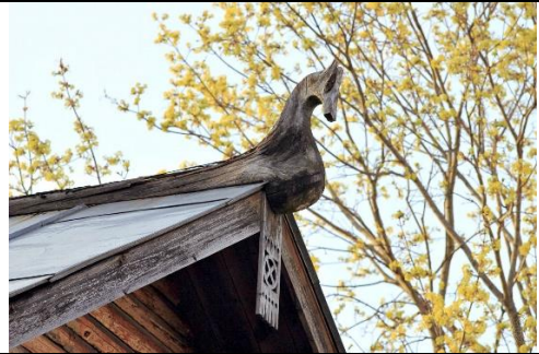
Мал. 66. Коник на дерев'яному будинку.

на його місце ставили новий, що уособлює нового господарям. Можливо, звідси походять вислови: «поставити на кон», «життя на кону» тощо.