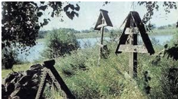
Мал. 67. Старий цвинтар. Кенозір'я. Архангельська область.

Отже, після смерті небіжчик має оселитися в «іншому» – своєму помешканні, відсутність якого провокує виникнення «неприкаяних», тобто «бездомних» покійників, які шкодять живим. Невипадково іноді форми поховальних хрестів мають специфічні дашки, що нагадують хатинку (мал. 67) 1 . Після смерті до моменту поховання (поки тіло серед живих) ще діють правила «цього» світу, актуальними залишаються також соціальні норми, про що свідчать археологічні знахідки (мал. 68). Після похорону такі норми зникають, оскільки усі поховані за обрядом покійники набувають статусу прашурів.