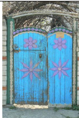
Мал. 14. Ворота. м. Кременчук.

Поріг переймає загальні смислові категорії житла і характеризується як «своя» територія (пор. із синонімією: «батьківська хата» - «батьківський поріг»). Міфологія порогу акумулює давніші значення і зіставляється з берегом як місцем порятунку від смерті 1 , що простежується у фразеологізмах «рідний берег»,