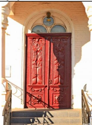
Мал. 13. Двері Кразнавчого музею м. Сміла, кінець XIX ст. [13].