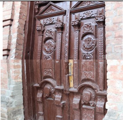
Мал. 11. Двері, м. Черкаси. Комплекс Школьнікова, кінець XIX ст. [12].

«Земні» двері тим чи іншим чином мають наслідувати свої небесні прототипи, що пояснює семантику знаків захисту, які складають орнаментальні композиції. Наприклад, на мал. 11 проглядається імітація світового дерева або axis mundi (осі світу), яка завершується вгорі стилізованими небесами у вигляді трикутника. Аналогічні композиції проглядаються обабіч дверей або дворових входів цього самого будинку (мал. 12). На інших входах зустрічаються імітації завісів, які мають приховати те, що відбувається у внутрішньому просторі будинку, над дверима стилізації «трьох небес» (мал. 13), на інших – зображено символи сонця (мал. 14).