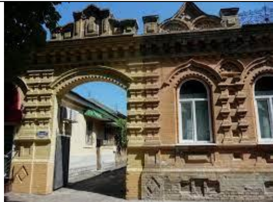
Мал. 12. Комплекс Школьнікова, кінець XIX ст.[12].