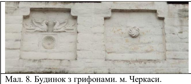
Мал. 8. Будинок з грифонами. м. Черкаси.

Ймовірність існування неприйнятних для сучасника обрядів жертвоприношення свідчать церковні заборони «класти тіло у фундамент». У давньохристиянському номоканоні зазначається: «При будівництві будинків мають звичай класти людське тіло як фундамент. Хто покладе людину на фундамент, тому покарання – дванадцять років церковного покаяння та триста поклонів. Клади в фундамент кабана, або бика, або цапа» [4, с. 156]. Згодом людські жертви було замінено на тварин. Залишкові ремінісценції цього обряду простежуються до сьогодні. Відгомін таких уявлень ще й досі дає про себе знати у фігурках жінок на кінцівках лицьових стріх, інколи вже вкрай стилізованих, а також у «кониках» на дахах, які є залишком уявлень про творіння світу з першоконя. Коник на даху – переказ про те, що душа господаря вселялася на сорок днів у власного коня. Давні балти приносили у жертву коня, пізніше розміри жертви редукувалися і вони ставили меншими, наприклад, півень, курка, потім безкровні жертви у вигляді монет, хліба.