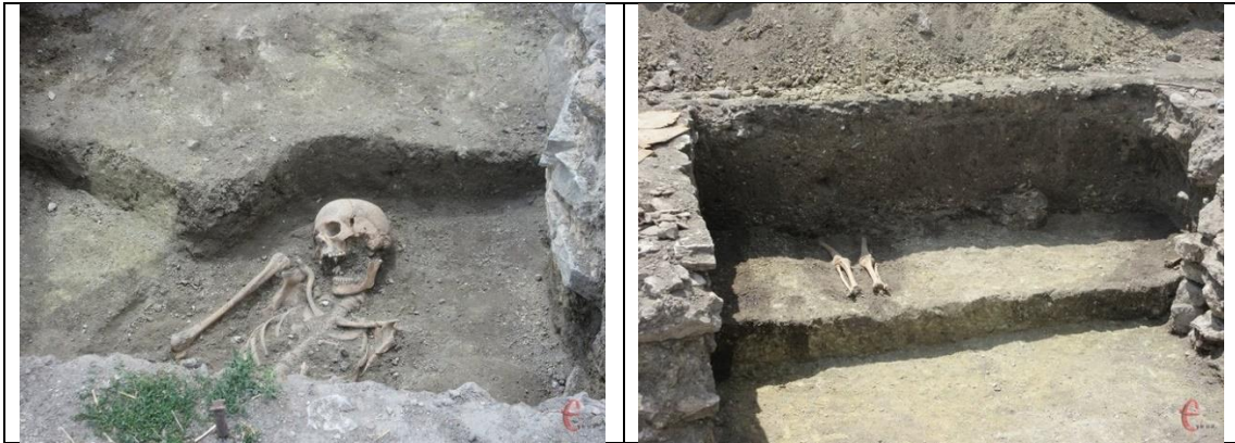
Мал. 6-7. Залишки давніх поховань у фундаменті на території Кам'янець-Подільського Старого Замку [6].

Можливо, звідси у Давній Русі комплекс захисних будівель називали дитинець, хоча існують інші версії походження поняття, ніж від д-р. дѣти – «діти». Зокрема, у переносному значенні так називали внутрішню, меншу частину складного об'єкта. Пов'язується також з дієсловом дѣти – «дівати; класти, ставити; будувати» або з прикметником дьнѣшний – «внутрішній», що походить від прислівника дьнѣ – «всередині» [7]. Поширеними є середньовічні легенди про мірвання тіні першого стрічного як рудименту ритуальних убивств, замкові привиди тощо.