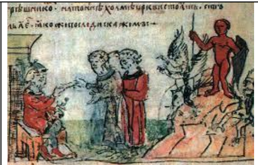
Мал. 4. Ідол Перуна у Києві.

до Києва, і приносив жертву кумирам із людьми своїми. І сказали старці і бояри: «Метнемо жереб на хлопця і дівчину, і на кого він упаде, – того заріжемо богам». А був варяг один [Тури], – двір його був [там], де є нині церква святої Богородиці [Десятинна], що її звів Володимир, – і варяг той прийшов був із Греків і потай держався віри християнської. І був у нього син [Іван], гарний з лиця і душею, і на сього упав жереб по зависті диявола, бо не терпів [його] диявол, який має владу над усіма; сей був йому наче терен у серці, і прагнув погубити [його] окаянний, і підбурих людей. І сказали, прийшовши, послані до нього, [варяга]: «Упав жереб на сина твого, бо зволили боги його собі. Тож учинимо жертву богам». І сказав варяг: «Не боги вони суть, а дерево. Сьогодні є, а завтра вже згнило. Не їдять бо вони, ні п'ють, ні говорять, а зроблені вони руками з дерева, сокирою і ножем. А бог один єсть, [той], що йому служать греки і поклоняються, бо сотворив він небо, і землю, і людину, і зорі, і сонце, і місяць, і дав життя на землі. А сі боги що зробили? Вони самі зроблені є. Не дам сина свого бісам». Вони тоді, пішовши, повідали [се] людям. А ті, взявши оружжя, пішли на нього і рознесли двір довкола нього. Він же стояв