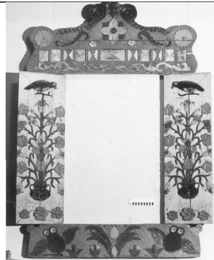
Мал. 2. Віконниця. Фонди Черкаського обласного краєзнавчого музею.

У плані лінгвістики відомою є архаїчна форма двоїни, що позначає лише подвоєні смислові категорії, апріорне існування яких є очевидним. Наприклад: близнюки, подружжя, очі, вуха, губи, руки, ноги, груди. За логікою жанру подвійні об'єкти є різними, однак функціонально є однаковими – очі бачать, вуха чують, подружжя народжує дітей, близнюки є однаковими тощо. Аналогічні семантику переймає міфологічна двоїна «Петро-Павло», оскільки вони є «братами по вірі» і виступають