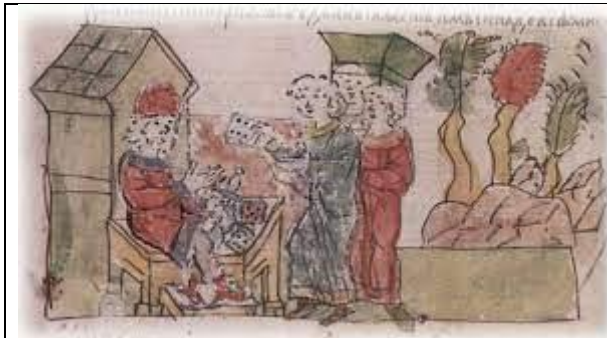
Мал. 3. Вибір жертви Перуну шляхом жеребкування.

Крім того, що Ілля Пророк є статусним святим, який керує небесною вологою, він повелитель грому і блискавки (у Біблії – небесною колісницею) 4 . Вважається, що прообразом святого, якому поклонялися давні русичі, є Перун – бог небесного вогню і небесної води. У літописі за Іпатіївським списком є свідчення, що Перуну приносили людські жертви: «У рік 6491 [983] пішов Володимир на ятвягів і взяв землю їх. І вернувся він