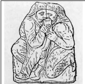
Мал. 4. Звичай побратимства у скіфів відображено на золотій бляшці з Кульобської могили.

приносили пиріжки, хлопці – воду і пиво) 5 . Крім шлюбної семантики вдале розв'язування дівочих вінків свідчило про «вдалу» майбутню долю дівчини, віщувало довгі літа і здоров'я 6 .