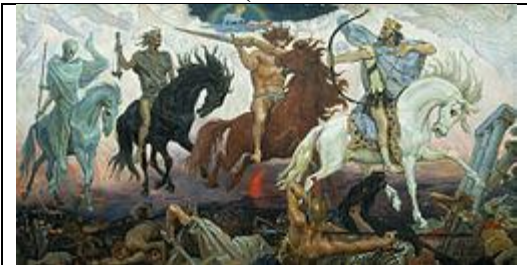
«Воїни Апокаліпсису» Віктор Васнецов, 1887

- Поняття «день Господній» на кшталт «дня Творення» стосується кінця світу, коли завершиться історія людства (Ісаї 7:18-25), оскільки лінійність божественного часу накладається на циклічність буденності. Фраза «День Господа» використовується дев'ятнадцять разів у Старому Завіті (Ісаї 2:12; 13:6, 9; Єзекіїля 13:5; 30:3; Іоїля 1:15; 2:1, 11, 31; 3:14; Амоса 5:18, 20; Авдія 15; Софонії 1:7, 14; Захарії 14:1; Малахії 4:5) і чотири рази в Новому Завіті (Дії 2:20; 2 Петра 3:10; 2 Фессалонікійцям 2:2) . Це також згадується в деяких інших місцях (Об'явлення 6:17; 16:14).