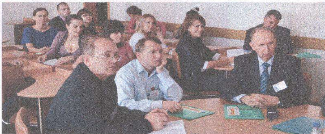
Учасники IX-го аграрного симпозіуму, 20 вересня 2012 р.