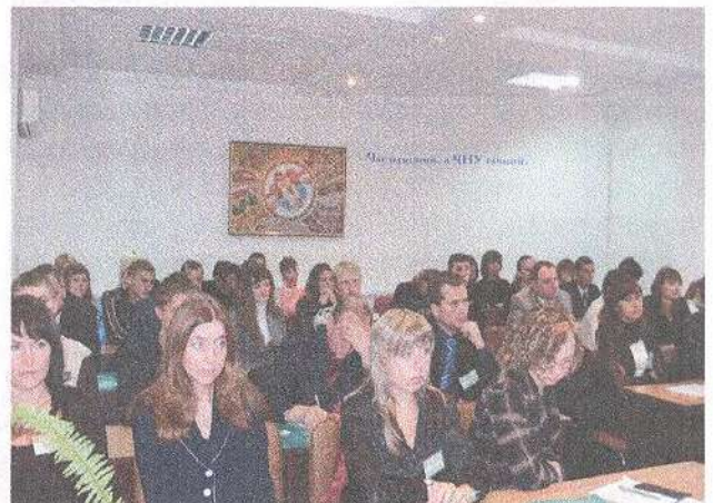
Учасники VI-го симпозиуму.

Симпозиуми з проблем аграрної історії набули стабільності у діяльності та популярності у наукових колах, проводяться кожні 2-3 роки і мають вже традиційний склад учасників з усіх куточків країни. До українських вчених долучалися й наукові сили зарубіжжя.